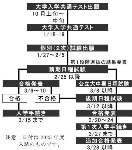
令和7年度大学入学共通テスト出題教科・科目の出題方法等

大学入学共通テストでは、国語・地歴公民・数学・理科・英語・情報の 6教科 の科目から最大 9科目 を選択して受験します。地歴公民と理科では、選択の方法によっては受験できなくなる大学・学部・学科・日程があるため、入試で必要となる科目について、よく調べておく必要があります。また、過去には「 地歴公民を受けておけばA判定が出ている〇〇大学に出願できたのに…。 」と涙をのんだ先輩もいました。自分が第1志望校として考えている大学があったとしても、大学入学共通テストの自己採点結果次第では、志望校変更の可能性も大いにあります。第2志望校や第3志望校を含め、入試科目について調査するとともに、可能な限り多くの教科・科目を受験しておきましょう。