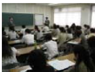
説明会(保護者・教職員対象)