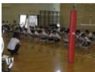
体験入学(体育コース)