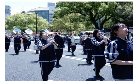
フラワーフェスティバル