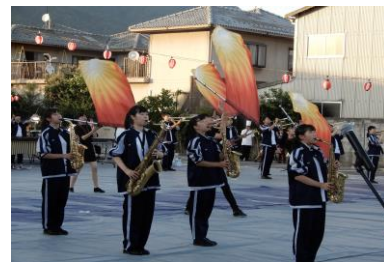
▲ 下向地蔵尊盆踊り大会での マーチングの様子

下向地蔵尊盆踊り大会が行われ、本校吹奏楽部がオープニングセレモニーとしてマーチングを披露しました。演奏・演技中、多くの方々から拍手をいただき、日頃支えていただいている地域の皆さんに笑顔と元気を届けることができたのではと思います。今後も沼田高校生が、地域の様々な場面で活躍できるよう期待しています。