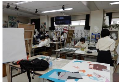
▲ クラブ体験・見学の様子