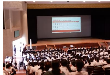
▲ 講堂での説明会の様子