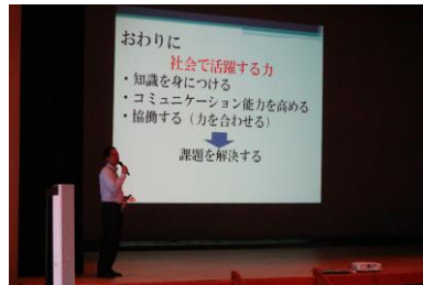
▲ 2学期始業式の様子

2学期始業式が行われました。始業式の中で校長先生からは、熱中症への対策を含めた体調管理についてのお話がありました。また3年生へ、お互いに高め合い、最後まで粘り強く取り組むことについて伝えられました。夏休み気分から切り替えて、常に高い目標を持ち、時間を大切にしながらがんばっていきましょう。