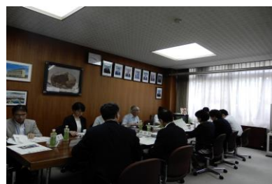
学校協力者会議の様子

第一回学校協力者会議が行われました。この会議は、学校・家庭・地域が一体となって連携・協力を図りながら、教育活動をより充実させることを目的として行われます。会議の中では地域の方や有識者などからの本校への意見や提言などが示唆されました。今後これらの意見を活かし、沼田高校の教育が更によくなるよう、チーム沼田として一丸で取り組んでいきます。