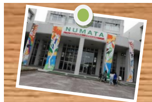
色彩豊かな文化祭!