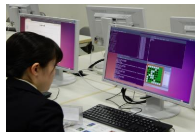
▲ 広島市立大学へ訪問