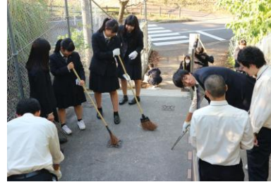
▲ さわやか清掃の様子

2年生による校内外のさわやか清掃が行われました。日頃通っている通学路周辺や校内で普段なかなか清掃できないところなどを清掃しました。各グループ、積極的に落ち葉やゴミなどを大量に拾い集めており、みな清々しいひとときを過ごしました。また、2年生体育コースの生徒は、同時時間帯に伴東小学校において、児童の下校見守り活動を行いました。