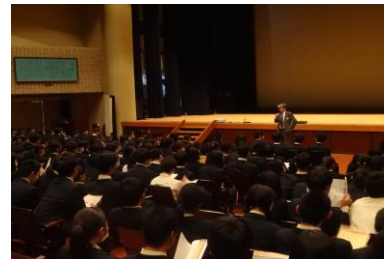
▲ 小論文講演会の様子

10月30日(月)は1年生を対象に、11月20日(月)は2年生を対象に小論文講演会が行われました。この講演会では、「作文と小論文の違い」「手書き文字の鉄則は濃く・大きく・丁寧に」など、小論文に取り組むにあたっての基本的な心構えや構成などについて学びました。3年生になってから取り組むのではなく、早い段階から準備を行い、「自分の言葉を持ち、自分の言葉で考え、伝える」技術を身に付けていきましょう。