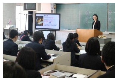
▲ 模擬授業：ディズニー映画から 見るアメリカの女性観