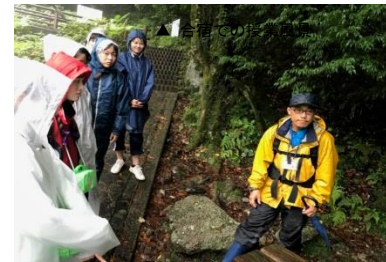
▲ 合宿での授業風景