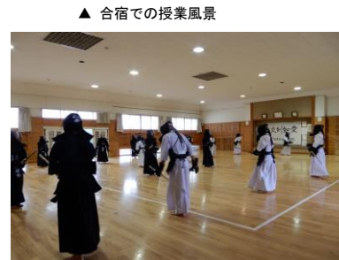
▲ 体育コース体験入学の様子

第二回学校紹介が行われました。当日は雨天にも関わらず、421名の中学生・保護者の方々に参加していただきました。今回のオープンスクールでは、来年の高校入試に向けて何をすべきか、高校に入学するまでにどのような力を身に付けるべきかなどについて説明されました。また、中学生の皆さんは、雨天にも関わらず、その後のクラブ見学や体育コース体験入学に積極的に参加していました。