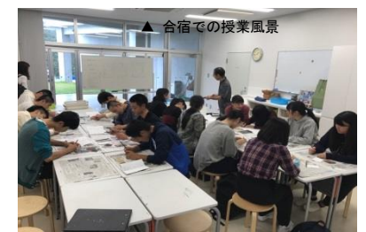
▲ 合宿での授業風景