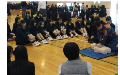
▲ 救命救急講習の様子

体育館にて3年生を対象に救命救急講習が行われました。目の前で人が倒れている場面に遭遇した際に、どのように適切な対応を取るべきかについて学びました。講習の後半では、心臓マッサージの体験や、AED(自動体外式除細動器)を実際に使用した講習が行われました。今回の講習での経験を活かし、いざという時に冷静に対処できるよう、日頃からイメージトレーニングをしていきましょう。