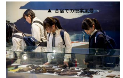
▲ 知覧特攻平和会館