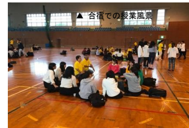
▲ 合宿での授業風景