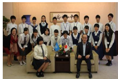
▲ プログラム参加時の写真

本校生徒がユニタール広島青少年大使に任命されました。ユニタールとは United Nations Institute for Training and Research (国連訓練調査研究所)の頭文字"Unitar"を取ったもので、国際社会で活躍する人材の育成を目指して設立された機関です。今後の研修では、異文化理解の難しさや面白さを体感し、また、それらをどのようにして発信していくのかについて考えていきます。11月に行われる国際フェスタ2017では、研修での成果を発表する予定です。