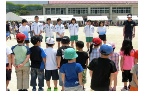
▲陸上部 かけっこ教室