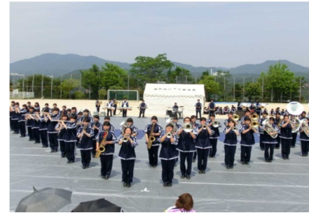
▲吹奏楽部 オープニングセレモニー

吹奏楽部が「健康まつり in 伴東」のオープニングセレモニーに出演し、陸上部が、幼児・児童を対象とした「かけっこ教室」を行いました。当日は晴天に恵まれ、多くの方々に参加されました。吹奏楽部の部員たちは日頃の練習の成果を存分に発揮し、素晴らしい演奏でした。陸上部の部員たちは、子どもたちに優しく丁寧に指導をしていました。