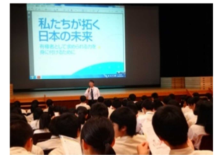
▲真剣に聞き入る生徒たち

6月2日(木) LHRの時間を利用して3年生対象に「主権者教育」が行われました。赤村教頭が講師となりスライドを利用してわかりやすく説明されました。7月10日には参議院議員選挙が実施されます。3年生のなかには実際に投票権がある生徒がいます。3年生の皆さんは、今回の授業で政治について今まで以上に身近に感じる事ができたと思います。また、高校生の政治活動についても正しい理解をしていきましょう。