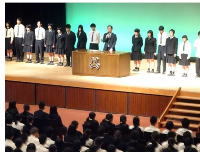
▲各クラブの代表者

第69回広島県高等学校総合体育大会と全国高等学校野球選手権大会広島県大会の壮行式を行いました。県総体に出場するクラブの各代表者と野球部の代表者が大会に向けての決意を述べました。そして最後に全校生徒で「沼田高校応援歌」を歌い、選手の健闘を祈りました。