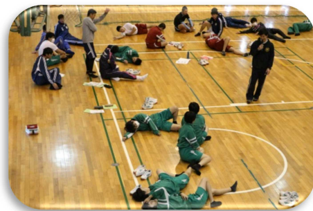
▲ 実践の様子(2時間目)