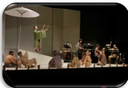
▲ 上演中 舞台上で生演奏

今年の芸術鑑賞は、「オペラシアター こんにやく座」による「オペラ おぐりとてくてー説経節「小栗判官照手姫」より」でした。生徒たちは毎年文化祭で沼田高校演劇部の演劇を見ていますが、今回はプロの演劇であり、さらには劇中の音楽を舞台上で生演奏したりと、上演中は多くの場面で笑いや驚きの声があがっていました。劇が終わった際には大きな拍手が会場全体から沸き起こりました。本格的な舞台装置や劇団の方々の迫真の演技や歌唱を間近で見ることができ、今年も素晴らしい芸術鑑賞となりました。