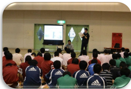
▲ 講義の様子(1時間目)

体育コースの生徒は日々厳しい練習に励んでいますが、彼らの身体は「成長期」というとても大切な時期にあります。日頃から必要なケアを個人レベルでも行いスポーツ障害を予防することで、各競技においての活躍を期待しています。