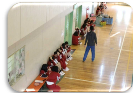
▲ 体育館での地震発生も想定