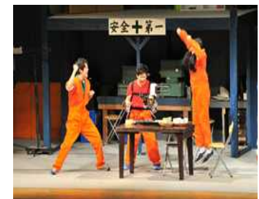
▲劇団「自由人会」による演劇の様子