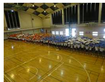
▲パネルパフォーマンス練習