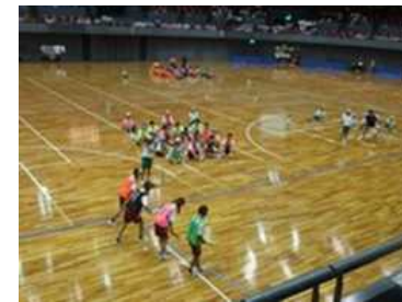
▲クラス対抗リレー