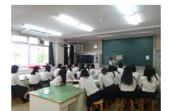
▲読み聞かせの様子