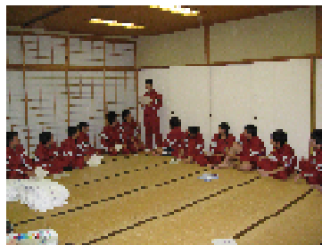
▲進路志望を語る会