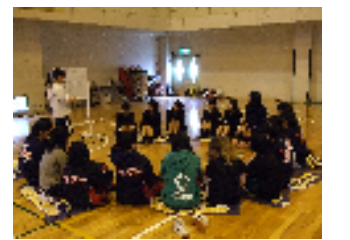
▲クラブ集会(女子バスケット)

4月15日(月)には、各クラブ活動場所などでクラブ集会が開かれました。本校では、基本的にこのクラブ集会が新入生の入部日となっています。例年、全校生徒のクラブ加入率は80%を超えており、今年度も多くの新入生が2・3年生から説明を受けている場面があらこちらで見られました。今後の活躍を期待しています。