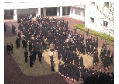
▲中庭でのお見送り

新たな出会いに喜ぶ一方で、これまでお世話になった先生方との悲しい別れもありました。講堂でご挨拶を頂いた後、昨年度の卒業生が名付けた「彩虹の木」と共に2・3年生が中庭に整列し、お見送りをしました。これからも先生方の教えを大切にしていきます。赴任先の学校でも、更なるご活躍をされることを祈念しています。