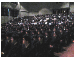
▲新入生代表・誓いのことば