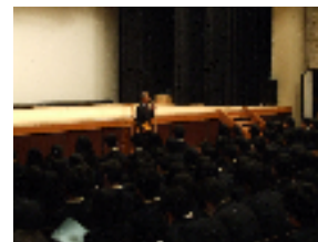
▲進路オリエンテーション

また、講堂では生徒会オリエンテーションが行われ、生徒会行事やクラス役員の説明、各クラブの部長らによるクラブ紹介もされました。