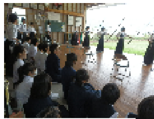
部活動を見学・体験