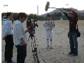
取材を受けるサッカー部主将

体育系はもちろん、文化系のクラブ活動も盛んなことで定評のある沼田高校。10月中にも様々な活動・話題がありました。10月2日(火)に男子サッカー部が広島テレビの「進めスポーツ元気丸」の取材(10月7日放映済)を受けたのをはじめ、山田コーチを中心に駅伝大会に向けて活動する陸上競技部の姿も、広島テレビの情報番組「テレビ派」で紹介(11月5日放映済)されました。また、吹奏楽部は14日(日)にマーチングの中国大会に出場しました。高得点を得て金賞を受賞しましたが、同点の2校が審査員投票に持ち込まれる中で、惜しくも全国大会出場を逃しました。