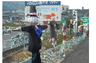
「かかし祭」左端が沼高の作品