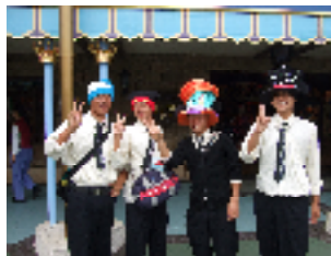
ディズニーランドで...

10月10日(水)～13日(土)の3泊4日の日程で、2年生が東京・横浜方面への修学旅行に行きました。キャリア学習の一環である「企業訪問」で研修を深めたり、完成したばかりでピカピカの「スカイツリー」を見学したり、ディズニーランドで一日を過ごしたりと、盛りだくさんのメニュー、そして天候にも恵まれて充実した4日間を過ごしました。帰りの新幹線の中からは、富士山がきれいに見えたそうです。