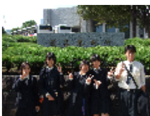
最高裁判所での研修