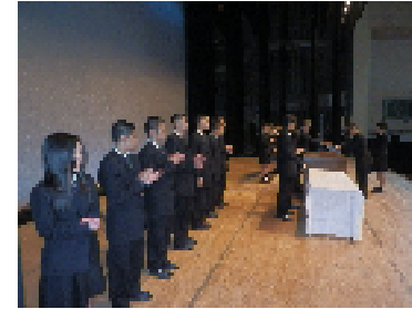
読書感想文・部活動の表彰