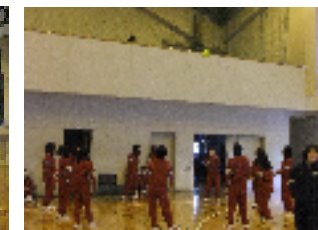
試合前には練習をして...