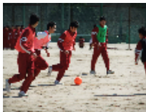
1年生はミニサッカー