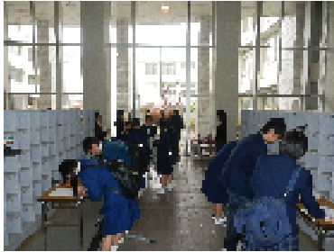
入学に向けた書類に記入する受験生