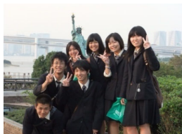
お台場での記念撮影