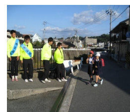
伴東小学校児童の下校を見守る生徒

10月31日(月)に、命の大切さを伝える力 推進プログラムの一環として、本校清美委員をはじめとした有志の生徒が、地域の清掃活動を行いました。また、2・9の生徒が、地域の安全なくらしへの意識を高め、今後の防犯ボランティア活動に積極的に参加できるようにすることを目的として沼田町の見守り活動に参加しました。生徒は地域の一員であることを自覚し、児童の安全な下校を見守る活動に一生懸命取り組んでいました。今後も様々な角度から、命の大切さについて考えるとともに、地域貢献に取り組んでいきます。