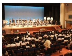
吹奏楽部による歓迎演奏

10月1日(土)に第2回学校紹介を開催しました。当日は320名の中学生・保護者の方々にご参加いただきました。講堂行事をはじめ、部活体験や質問コーナー(本校生徒が中学生の質問に対応)などを通じて、本校の様子を十分に感じてもらえたことと思います。ご参加いただいた中学生・保護者の皆様、ありがとうございました。