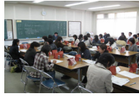
保護者懇談の様子