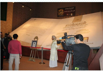
ギネスにも認定されている

ここでは、本にまつわるちょっとしたトリビア（豆知識）を紹介します。今回は世界一大きな本。今回紹介するのは『This the Prophet Mohamed』というイスラムの本は、縦が8m、横は5m、重量は約1500キログラムもあるそうです。読んでいる途中でうっかり挟まれたら、大変なことになるかもしれません。